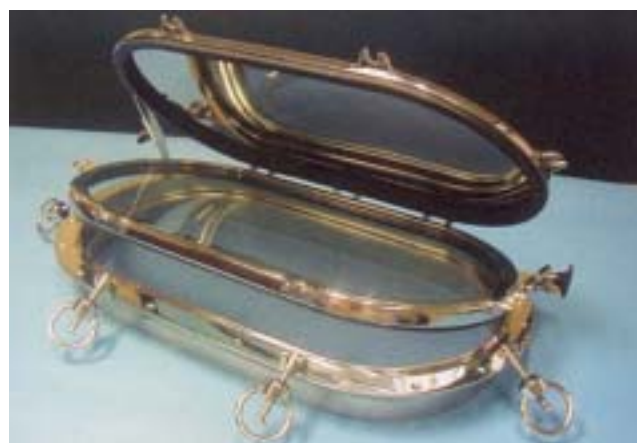
1044 / 1045