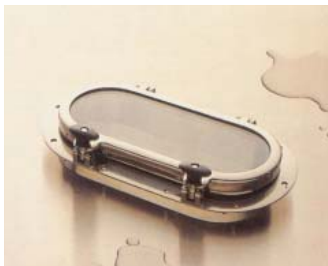
1042 / 1043